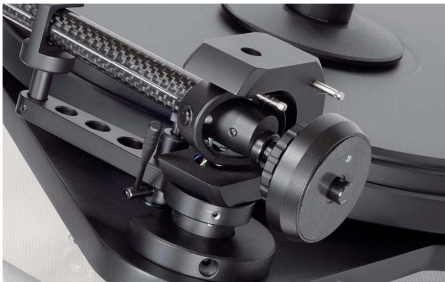
Ramię zastosowane w 6 PerspeX to najnowsza konstrukcja 9cc Evolution.

Główne łożysko gramofonu, na którym spoczywa talerz. Tu jest odwrócone, tj. na stalowej osi zamontowano ceramiczną kulkę, zaś łożysko znajduje się w talerzu.