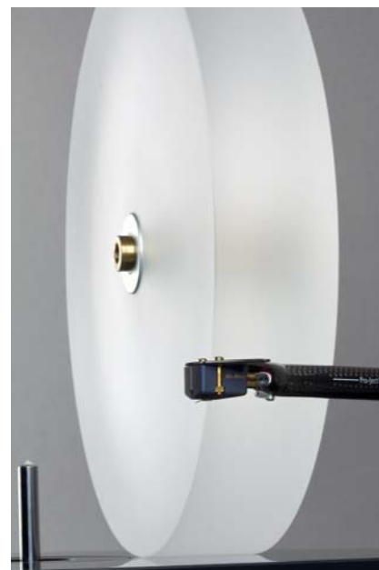
Gruby talerz wykonano z akrylu.

W stalowym bloku zamocowano odwrócone łożysko talerza. Ponieważ talerz jest wyjątkowo ciężki, zastosowano magnetyczne zawieszenie, po raz pierwszy wprowadzone również w modelu „10”. Jakiś czas później swoją wersję tego opracowania wprowadziła do produkcji firma Clearaudio. Pomysł jest prosty: w podstawie mocuje się krążek magnesu, a w talerzu niewielki trzpień z namagnesowanej stali. Pozwala to odciążyć łożysko główne, zmniejszając szumy przesuwu i zużywanie się ceramicznej kulki. Najdroższe modele Clearaudio a także Transrotora korzystają z talerzy w pełni odseparowanych magnetycznie od podstawy. To jednak bardzo drogi typ zawieszenia; wydaje się, że rozwiązanie tego typu, co w PJ, jest dobrym kompromisem, ponieważ została zachowana mechaniczna łączność między talerzem i podstawą, co znacząco stabilizuje obroty.