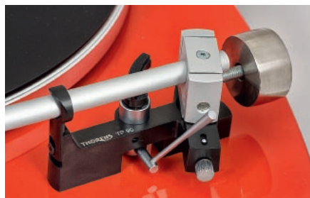
Częścią gramofonu jest fabryczne ramię TP90 z kompletem możliwości regulacyjnych.