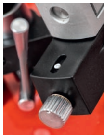
Zamiast żyłki i ciężarka – firmowy, magnetyczny system do precyzyjnego ustawiania antyskatingu.