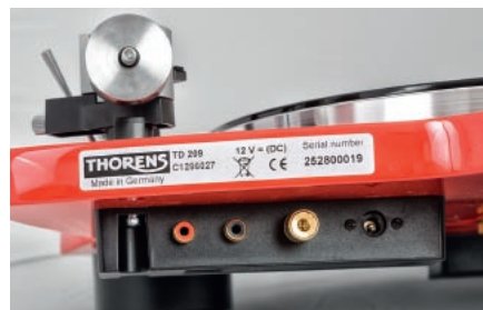
Panel przyłączeniowy zamiast kabla – podłączymy dowolnie wybrane interkonekty.