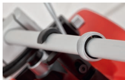
Tajemniczy pierścień, umieszczony mniej więcej w połowie długości ramienia, to część systemu tłumiącego drgania.