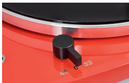
Trójpozycyjny wyłącznik z selektorem obrotów umieszczono w wygodnym miejscu.