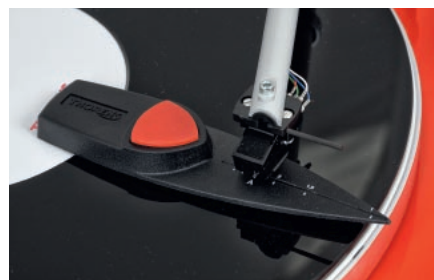
...oraz prosta, mechaniczna waga do ustawiania siły nacisku igły.