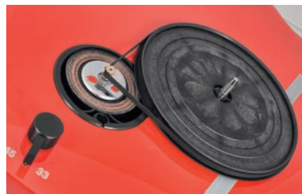
Silnik zamocowano w głównym chassis, co nadaje gramofonowi zwartą, kompaktową formę, za pomocą układu sprężyn zredukowano wpływ silnika na resztę układu.