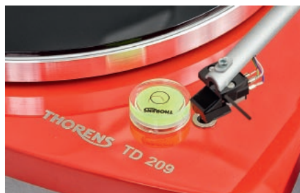
Thorens dorzucił kilka przydatnych „drobiazgów”, takich jak poziomica...