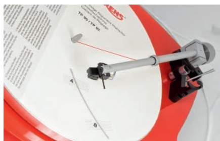
W komplecie znajdziemy matę z szablonem ułatwiającym ustawienie wkładki; przyda się przy jej wymianie, bo gramofon jest złożony i skalibrowany fabrycznie.