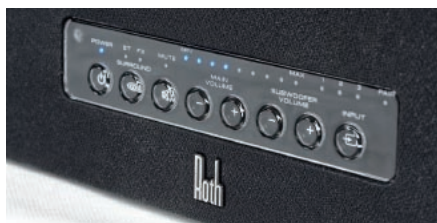
Rządka niebieskich diod i okrągłych przycisków wygląda oryginalnie, choć niezbyt subtelnie.

Nad sukcesem dźwięku przestrzennego pracują też procesory DSP, realizujące firmowy algorytm Fractal Expansion.