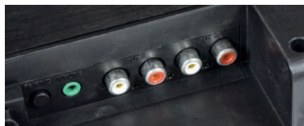
Do BAR-a podłączymy jedynie analogowe źródła sygnału.