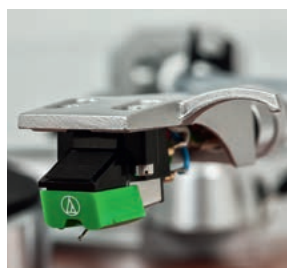
Wkładkę AT95E można właściwie stosować w ciemno, zawsze daje przyzwoite rezultaty, a gdy przez brak wprawy uszkodzimy ją, możemy wymienić samą igłę.