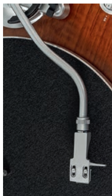
Ramię (w kształcie litery S) pozwala na łatwą wymianę główki – to cechy często spotykane w wielu japońskich gramofonach.