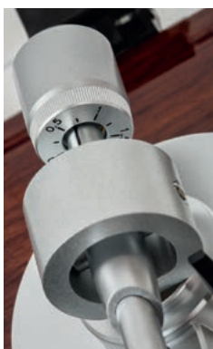
Parametr VTF ustalamy kręcąc przeciwważą.