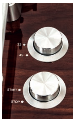
PRO500BT to gramofon manualny, ale przygotowana elektroniczną zmianę prędkości obrotowej.