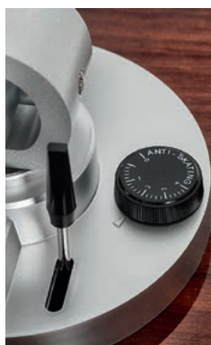
Do regulacji anti-skatingu służy pokrętko z wyraźnie naniesioną skalą, umożliwiające precyzyjne ustawienie.