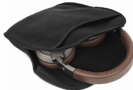
Przeguby można obrócić, a słuchawki złożyć – w ten sposób znacznie wygodniej je przenosić i przechowywać. Zadbano o sprawy związane z mobilnością – w zestawie jest miękkie etui.