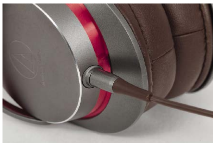
Wtyki i gniazda zainstalowane w muszlach pozwalają na połączenie zbalansowane.